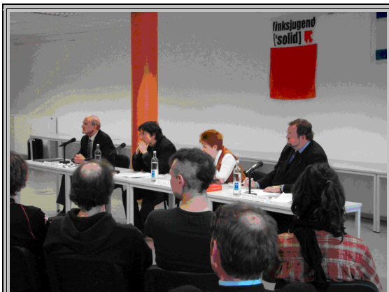
Petra Pau (2. von rechts) bei der Feier zum 60. Jahrestag der Gründung des Zionistenstaates Israel der BAK Shalom, der prozionistischen Arbeitsgemeinschaft der Parteijugend

Die Berliner Bundestagsabgeordnete Petra Pau gehört ebenfalls zu den Förderern der Lobbyisten des rassistischen zionistischen Staates Israel. Petra Pau gehört zu den Erstunterzeichnern der Lügen-Kampagne Stop the Bomb[2], mit der bekannte antideutsche Aktivisten unter Vorspiegelung falscher Tatsachen versuchen, einen Krieg gegen den Iran zu vorbereiten und zu rechtfertigen. Auf der Webseite der Lügenkampagne Stop the Bomb wird Petra Pau mit den Worten zitiert: